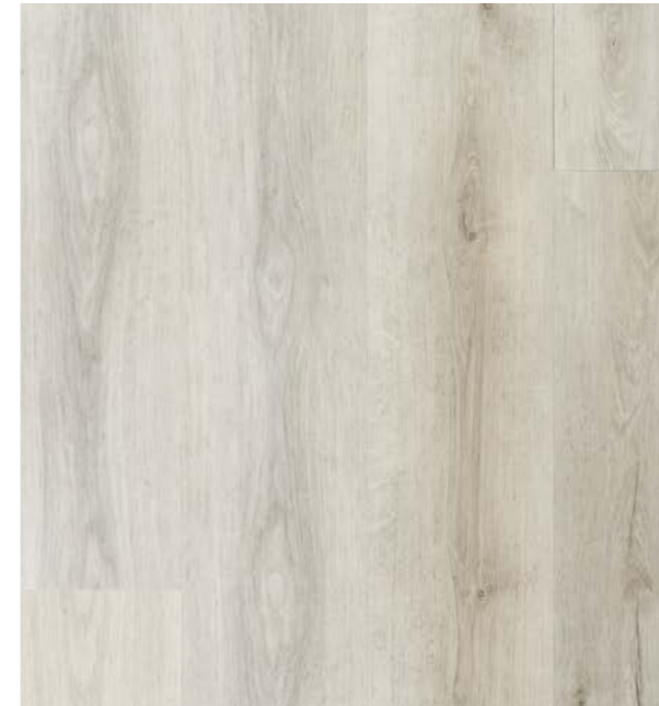
品番 SPC-WH 〈ホワイト〉