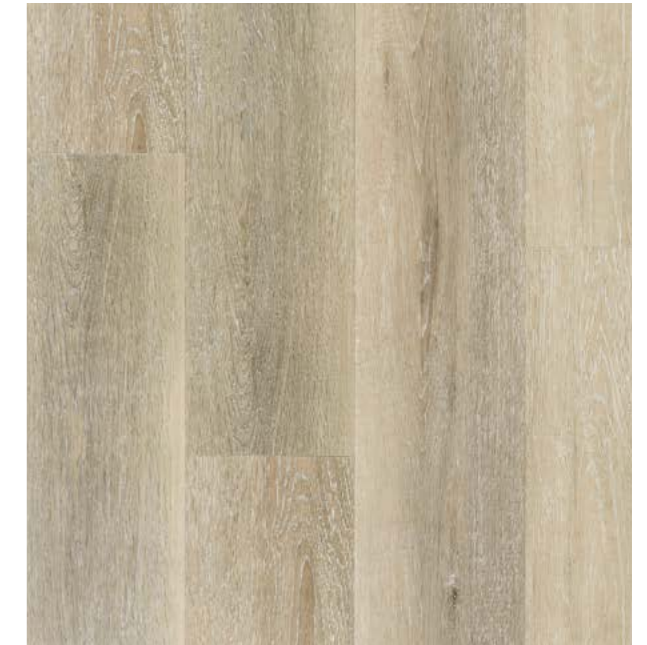
品番 SPC-GR 〈グレー〉