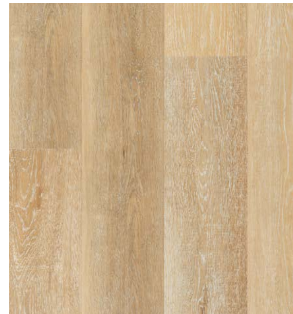
品番 SPC-NA 〈ナチュラル〉