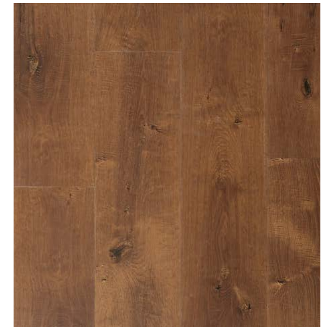
品番 SPC-BR 〈ブラウン〉